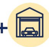
ГАРАЖ ИЛИ МАШИННОЕ МЕСТО